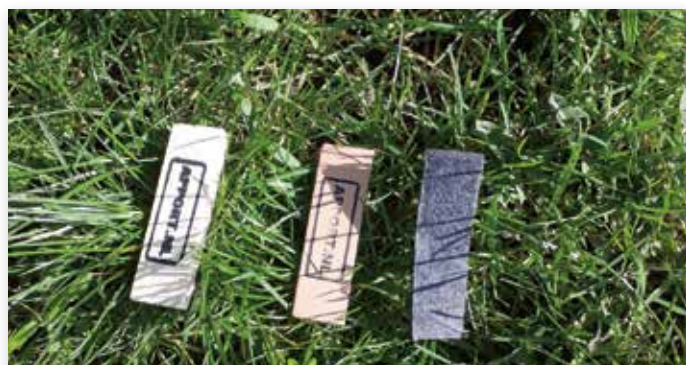
Voor alle deelnemers zijn er drie speurvoorwerpen die ze moeten vinden

Het Corona-virus houdt heel Nederland, dus ook de kynologie, in de greep. Zo moesten voor april en mei alle hondensportevenementen en -trainingen afgezegd worden. Omdat de selectiewedstrijden voor juni zijn gepland, gaan wij er vooralsnog van uit dat het evenement kan doorgaan. Uiteraard volgen wij hierin het advies van de Nederlandse overheid.